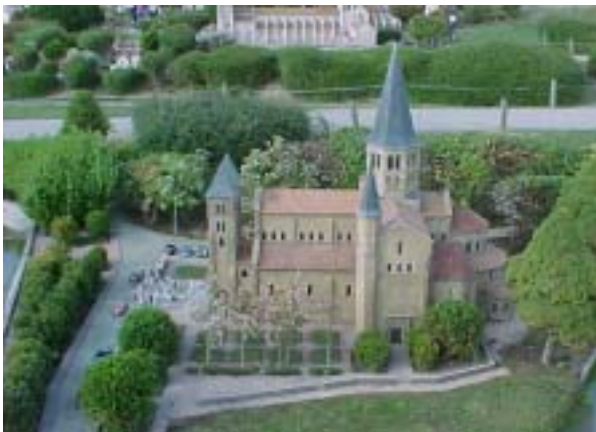
La basilica del Sacro Cuore a Paray Le Monial

Fu incompresa dalle consorelle e malgiudicata dai superiori. Anche i direttori spirituali dapprima diffidarono di lei, giudicandola una fanatica visionaria. Il beato Claudio La Colombière divenne preziosa guida della mistica suora della Visitazione, ordinandole di narrare, nell'autobiografia, le sue esperienze ascetiche. Per ispirazione della santa, nacque la festa del Sacro Cuore, ed ebbe origine la pratica dei primi Nove Venerdì del mese