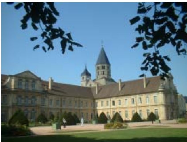
L'Abbazia di Cluny

3 Ricordati di santificare la festa, non disertando mai l'assemblea eucaristica: la domenica è la Pasqua della tua settimana, il sole è l'eucarestia e il cuore