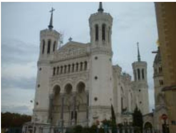
La Basilica di Lione

Siamo entrati nel Santuario con trepidazione ma nello stesso tempo con familiarità, perche nell'anno sacerdotale, conclusosi nel