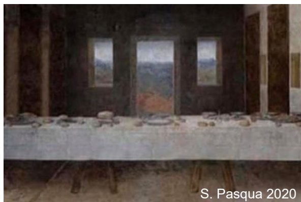
S. Pasqua 2020

L'ultima cena e il distanziamento sociale